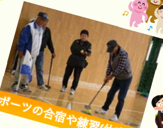
スポーツの合宿や練習(体育館)