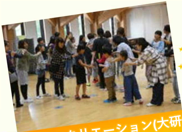
PTA活動のレクリエーション(大研修室)

学校等の体験活動だけでなく、PTA活動や子ども会、各種研修等、子どもから大人まで様々な用途に使用できます。活動メニューの御相談にも対応していますので、お気軽にお問い合わせください。皆様の御利用をお待ちしています!