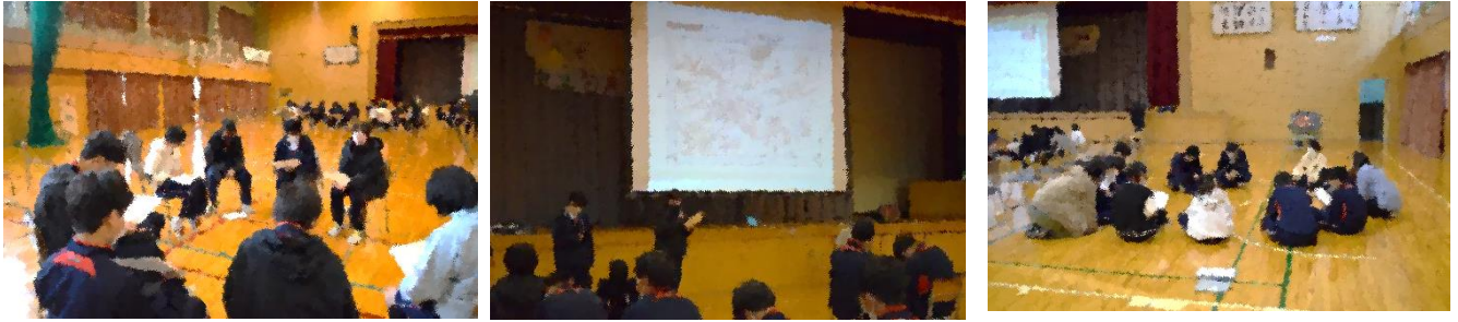
<いじめ見逃しゼロ集会の様子>